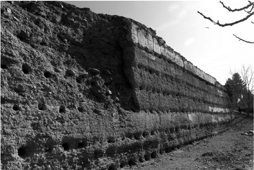
Cara oeste del muro. Vista de la mitad sur. (FLM)